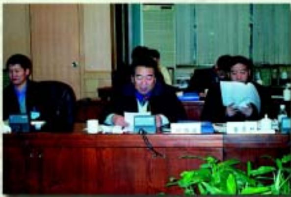
当地林业局介绍林场情况