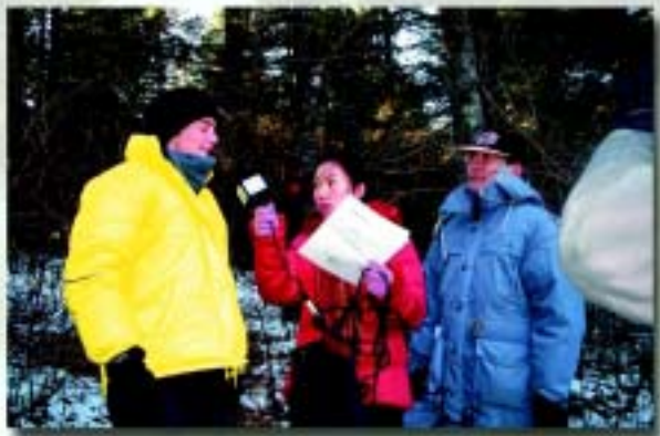
中央电视台现场采访